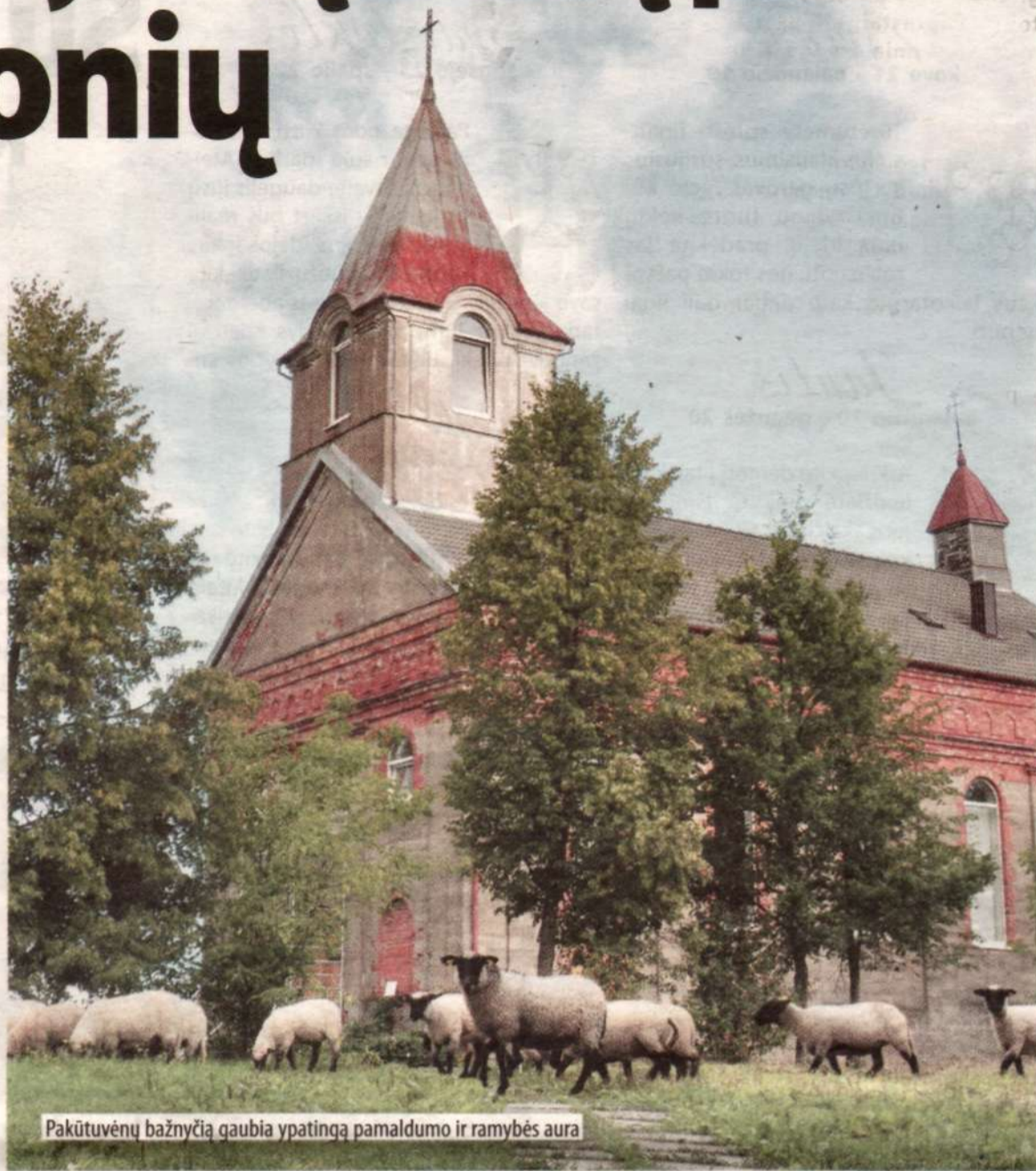
Pakūtuvėnų bažnyčią gaubia ypatingą pamaldumo ir ramybės aura