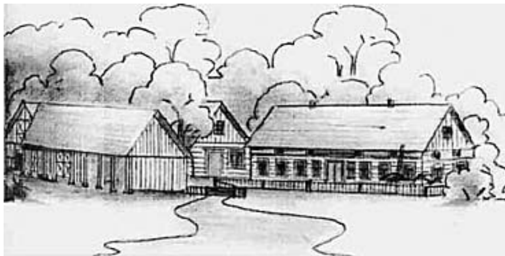
Stonkų sodyba apie 1935 m.