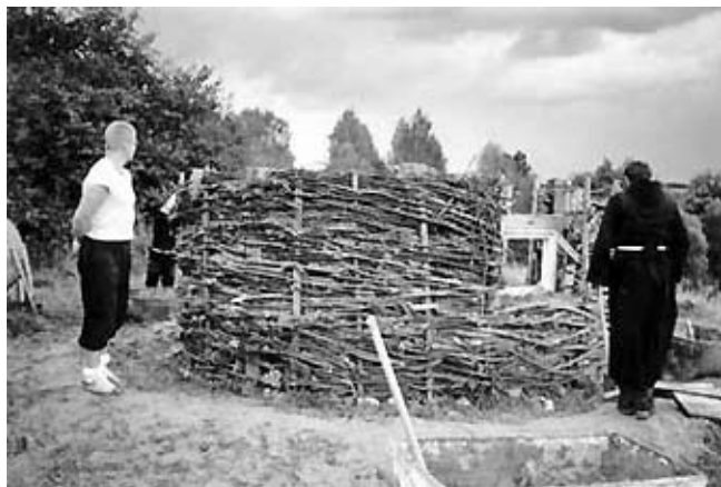
Broliai pranciškonai statosi molinę trobelę – „molinuką“ 1991 m.