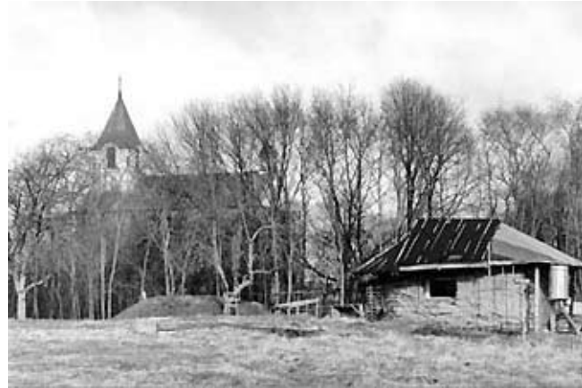
„Molinukas“ 1999 m.