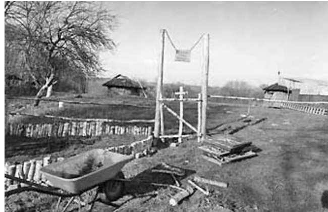
Molinuko aplinka 1998 m. pavasarį ir rudenį.