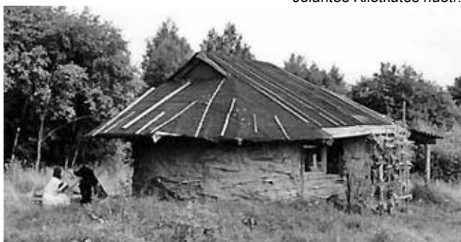
„Molinukas“ 1998 m.