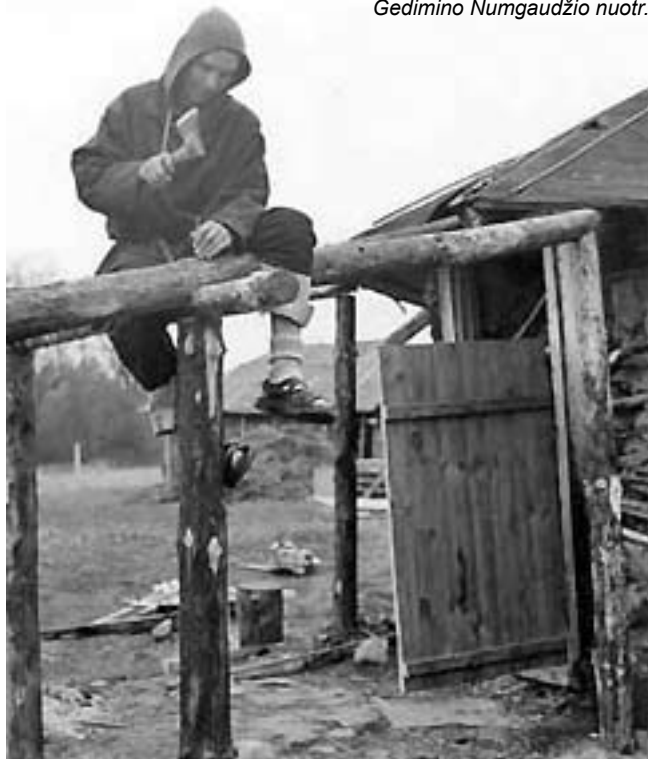
Molinukas turės verandą. 1995 m.