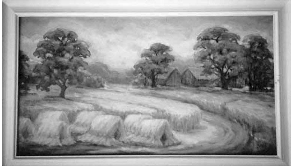
Stonkų giminės sodybos piešinys.

užėdžio [ėdžių] prišti, jau palaidi, kariai [kumeliai, kumeliukai], arba kumeliai, nuo senių arklių atskiesti ir kartimis kampe užšaudyti stovėjo; ta arklių kūtė turėjo nuo saulėtekio duris, pro kurias arklius ir bandą varė girdyti, jaukiam orui esant, speiguotie [speigui esant] drungnu vandeniu iš namo geldose girdė. Už tos arklių kūtės buvo dar kiaulių kūtėlė, arba tvartelis, kartais neb tose pačiose namo šalinėse sienose, bet pridurtose prie galutinės namo sienos ypatingu [atskiru] rentiniu, daug žemesniu už namo sienas. Žąsys, pylės [antys] bandos tvarte buvo laikomos. Ir taip gaspadorius, sėdėsis ant suolo namo pasieny, visą savo piešą [kaimenę, mantą, turta] galėjo regėti.