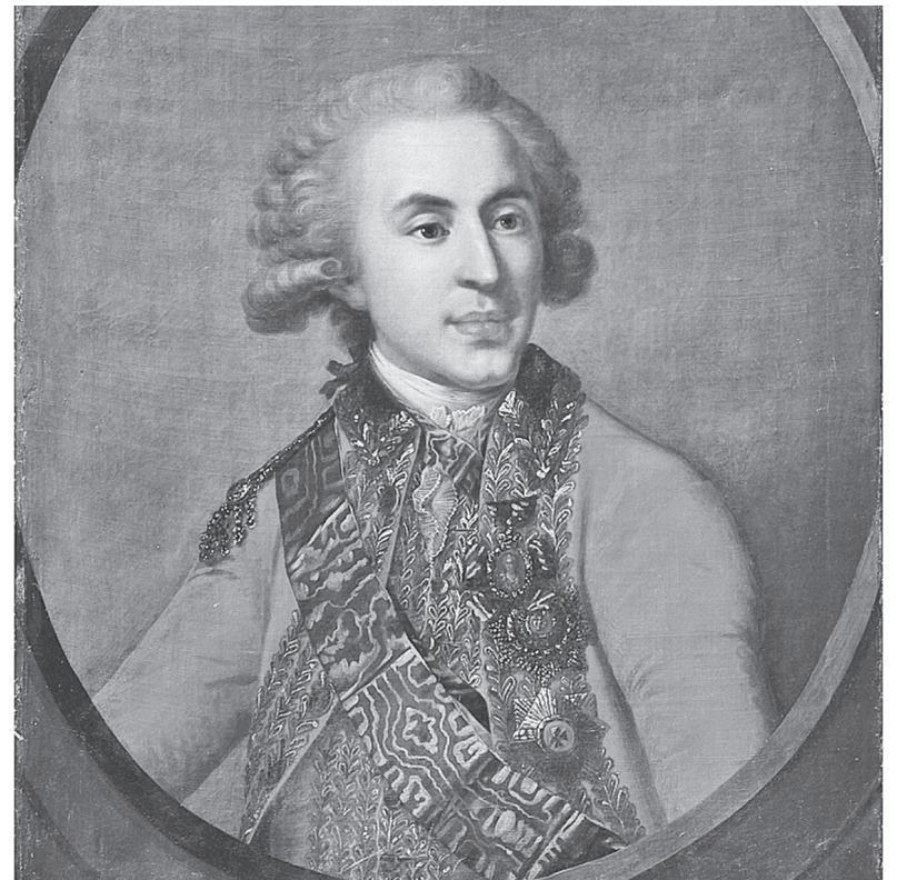
Platono Zubovo (1767–1822) portretas buvęs Kretingos vienuolyne. Dail. Johann Baptist Lampi, XVIII a. II pab. – XIX a. 3 deš. Portretas saugomas Nacionaliniame M. K. Čiurlionio muziejuje (ČDM Mt-1529).

1906 m. Konstantinas Gukovskis ir 1913 m. Stanislovas Karvovskis rašė, kad vienuolyno biblioteko-