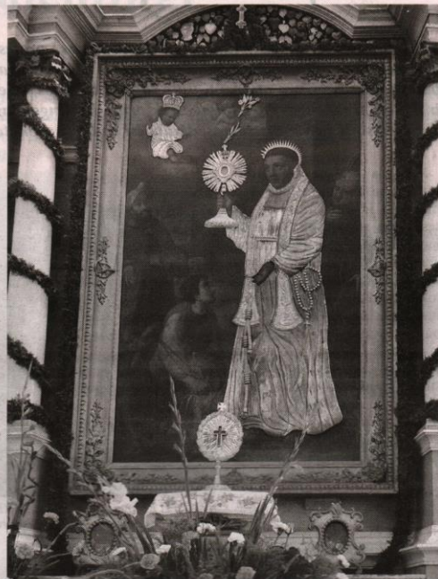
Šv. Antano paveikslas ir relikvija.

Tarpukariu išpopuliarėjus šv. Antano atlidams Kretingos miesto burmistras priėmė