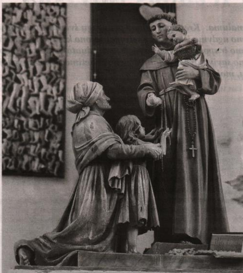
Šv. Antano skulptūra su duona.

Šv. Antano atlidai labiausiai išpopuliarėjo tarpukariu 1922–1939 m., kai Kretingos vienuolynas tapo Lietuvos pranciškonų sostine. Šv. Antano atlidai pradėjo konkuruoti su iki tol dominavusiais Porciunkulės atli-