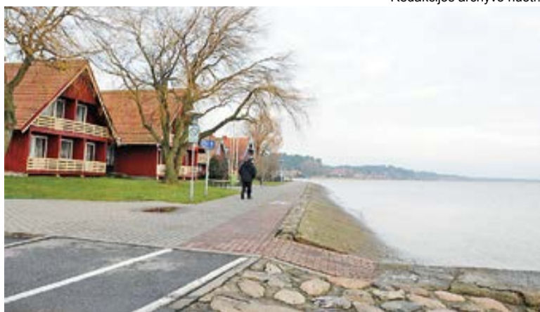
Redakcijos archyvo nuotr.

Prie šios iniciatyvos savanoriškai prisijungė 11 savivaldybių administracijų iš 60: Biržų rajono, Druskininkų, Elektrėnų rajono, Jonavos rajono, Joniškio rajono, Neringos, Šakių rajono, Šalčininkų rajono, Telšių rajono, Utenos rajono bei Vilniaus miesto savivaldybė. Savivaldybės užregistravo ir papasakojo apie 27 ES lėšomis finansuotus projektus, kurių bendra suma sudaro daugiau kaip 89,7 mln. litų. Daugiausiai projektų iniciatyvai pa-