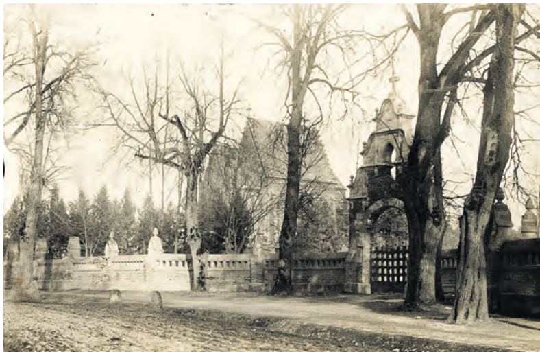
► Tiškevičių mauzoliejus-koplyčia garsiojo Kretingos fotografo Alfonso Survilos fotografijoje