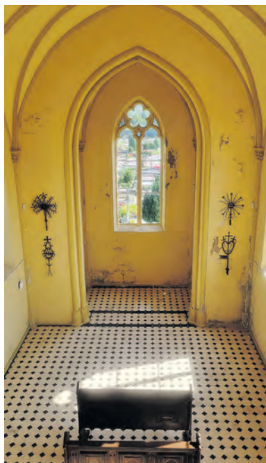
► Iš Tiškevičių laikų išlikusios koplyčios vidaus apdailos detalės

plytas ir dabar galima įžvelgti koplyčios stogo smailėse, bokšteliuose.