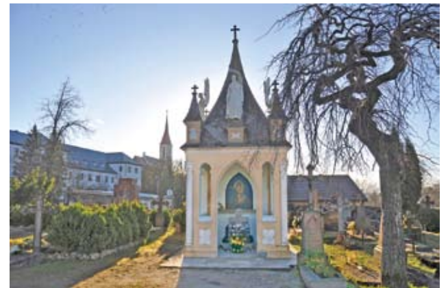
Žmonės ateina pasimelsti prie J. A. Pabrėžos kapo, ant kurio pastatyta neogotikinio stiliaus koplytėlė.