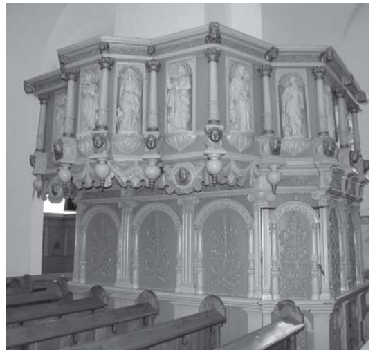
Iš kairės: Kretingos Viešpaties Apreiškimo Švč. Mergelei Marijai bažnyčios Kankinių koplyčios fragmentas ir bažnyčios sakykla.