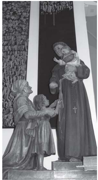
Iš kairės: Kretingos Viešpaties Apreiškimo Švč. Mergelei Marijai bažnyčios altorius ir skulptūros.